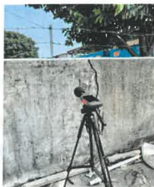
厂界西北面外 1 米处 3#