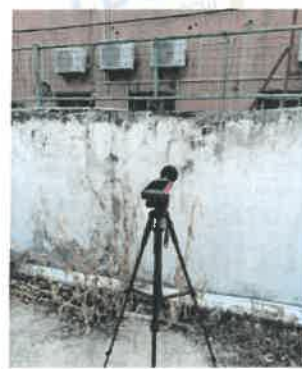
厂界东北面外 1 米处 4#