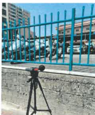
厂界西南面外 1 米处 2#