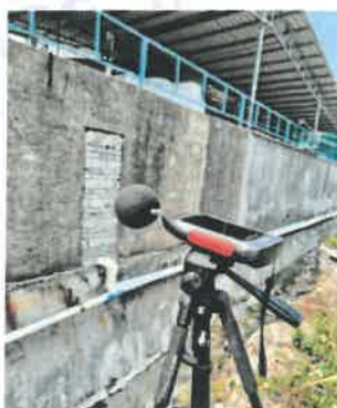
厂界东南面外 1 米处 1#